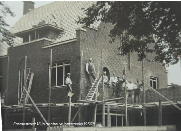
Emmastraat 16 in aanbouw (omstreeks 1936?)