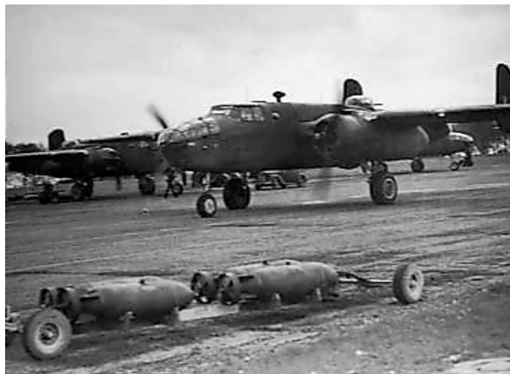
Bommen liggen klaar voor een van de toestellen van het squadron.