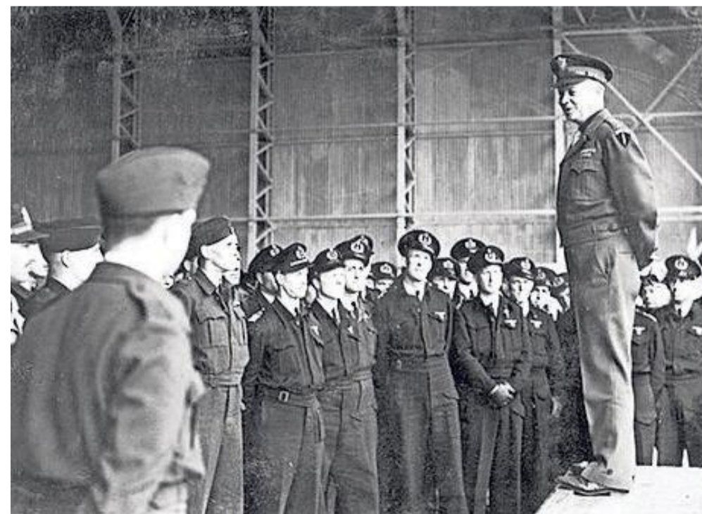
Bijzondere foto; generaal Dwight Eisenhower bezoekt het Dutch Squadron