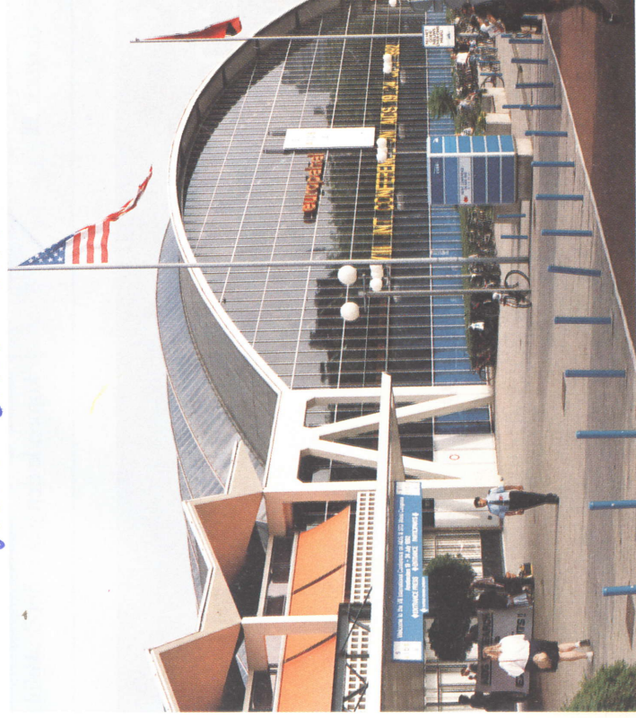
Preventiemaatregelen stonden centraal op het Aids-congres.

De Wereld Gezondheids Organisatie schat dat het aantal HIV-geïnfecteerden momenteel tussen de